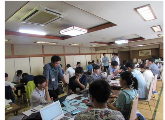
プランニングの様子