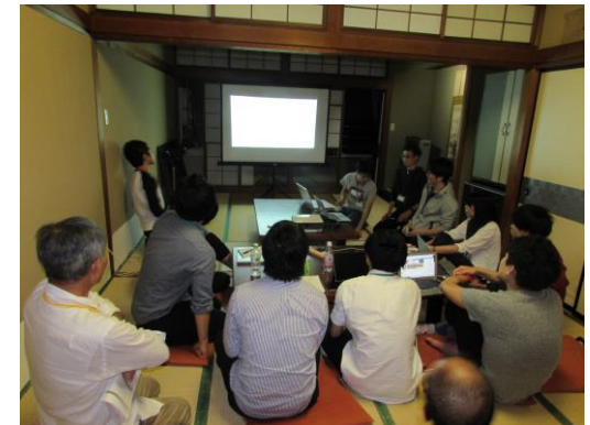
中間報告会の様子